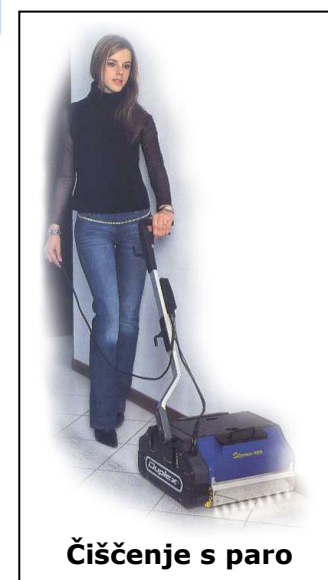
Čiščenje s paro